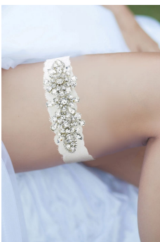
Καλτσοδέτα με ασημί κέντημα με στρας

“Η εμπειρία της NANTINA είναι ξεχωριστή και κάθε δημιουργία μας έχει τόσο άψογα χαρακτηριστικά που κάθε νύφη ικανοποιείται απόλυτα.”